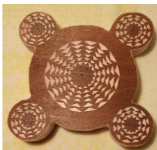
Рис. 2. Образец декоративной подставки